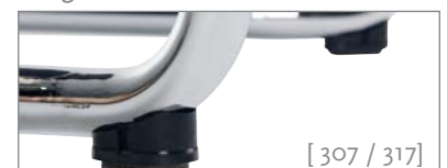
[ 307 / 317 ]