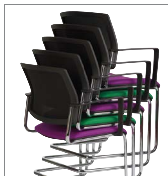
Stapelbar bis 5 Stühle