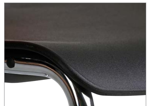
Sitzschale aus robustem Kunststoff .