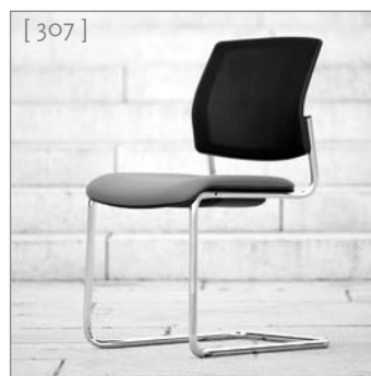
FILIGRANES design MIT ÜBERZEUGENDER funktion