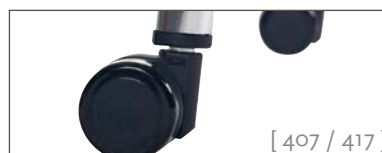
[ 407 / 417 ]

Rollen Ø 37 mm für harte oder weiche Böden