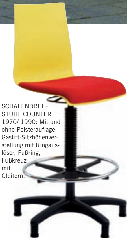
SCHALENDREH-STUHL COUNTER 1970/ 1990: Mit und ohne Polsterauflage, Gaslift-Sitzhöhenverstellung mit Ringauslöser, Fußring, Fußkreuz mit Gleitern.