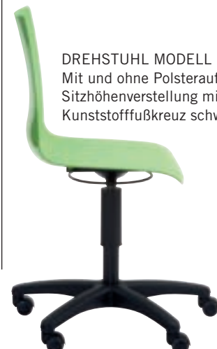
DREHSTUHL MODELL 1900/1950: Mit und ohne Polsterauflage, Gaslift-Sitzhöhenverstellung mit Ringauslöser, Kunststofffußkreuz schwarz mit Rollen.

Gesagt, getan: Die Sitzschale wurde vom Gestell abgeschraubt, umgekehrt auf die Straße gelegt – und dann wurde mit dem Vorderrad eines Smarts einfach „darauf“ gefahren. Etwas mulmig war den Testern dabei schon,