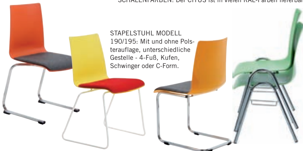
STAPELSTUHL MODELL 190/195: Mit und ohne Polsterauflage, unterschiedliche Gestelle - 4-Fuß, Kufen, Schwinger oder C-Form.